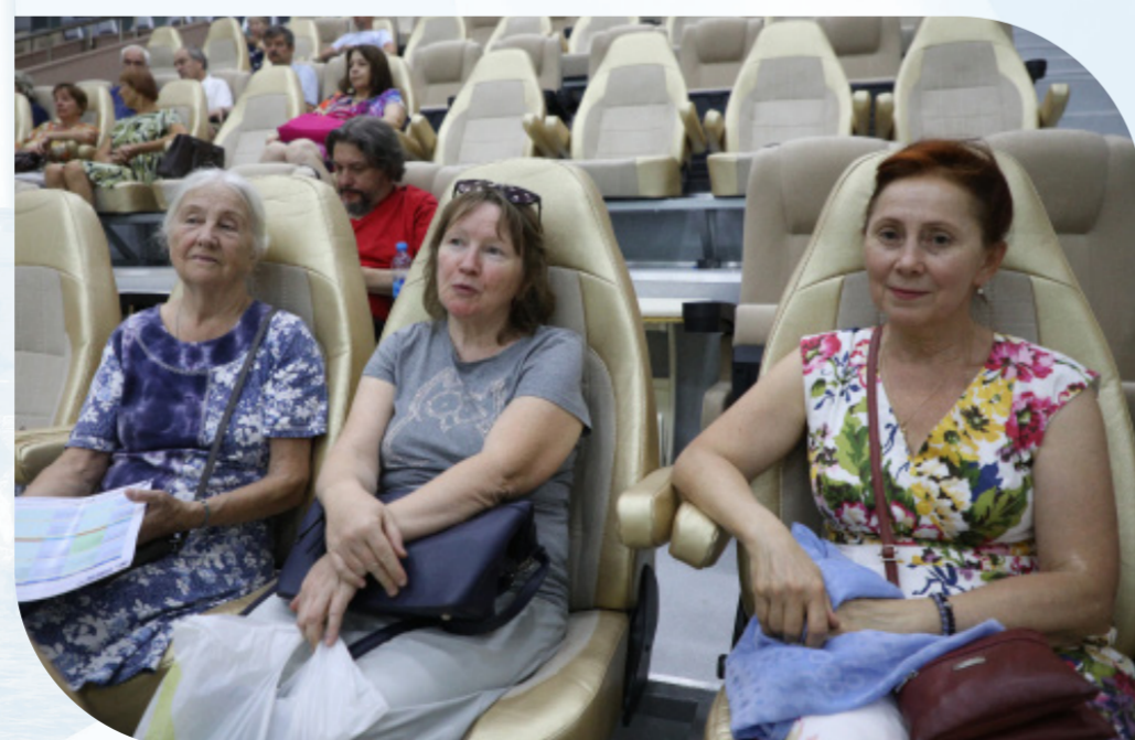
Беседовала Елена Мурашкина

– Чтобы он оставался, чтобы процветал, приезжали люди, чтобы как и раньше, он проходил в мае. Сейчас он перенесен по известным причинам, организаторы молодцы, провели его, все состоялось, надеюсь. На будущий год мы встретимся в Севастополе в мае.