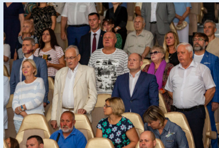
Открытие кинотеатра «Россия», приуроченное к Дню Российского Кино.