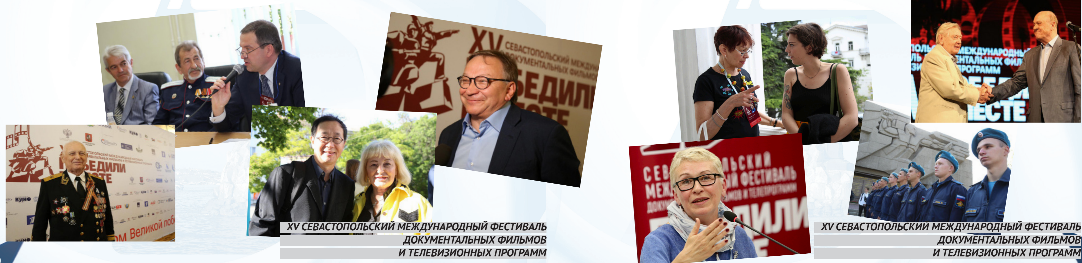
XV СЕВАСТОПОЛЬСКИЙ МЕЖДУНАРОДНЫЙ ФЕСТИВАЛЬ ДОКУМЕНТАЛЬНЫХ ФИЛЬМОВ И ТЕЛЕВИЗИОННЫХ ПРОГРАММ

Искренне желаю вам, дорогие друзья, больших успехов, ярких открытий, нескончаемого творческого вдохновения, благодарных зрителей и новых свершений во имя общей памяти грядущих поколений.